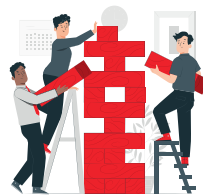
Taller de ansiedad y manejo del estrés