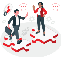
Taller de procesos de pensamiento